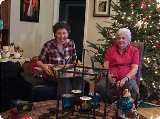
The 2 Alicias